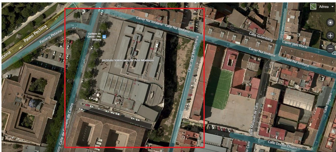
Imagen del edificio y jardín posterior:

Ocupa una superficie de 18.200 m 2 y alberga ocho galerías destinadas a exposiciones permanentes y temporales. Una de ellas, la Sala de la Muralla, tiene acceso independiente y muestra los cimientos de la antigua muralla medieval de Valencia, construida en la segunda mitad del siglo XIV.